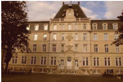
Lycée Jean Jaurès Reims

Allier la passion de la danse ou de la musique avec l'enseignement général indispensable à un artiste cultivé pour poursuivre des études supérieures.